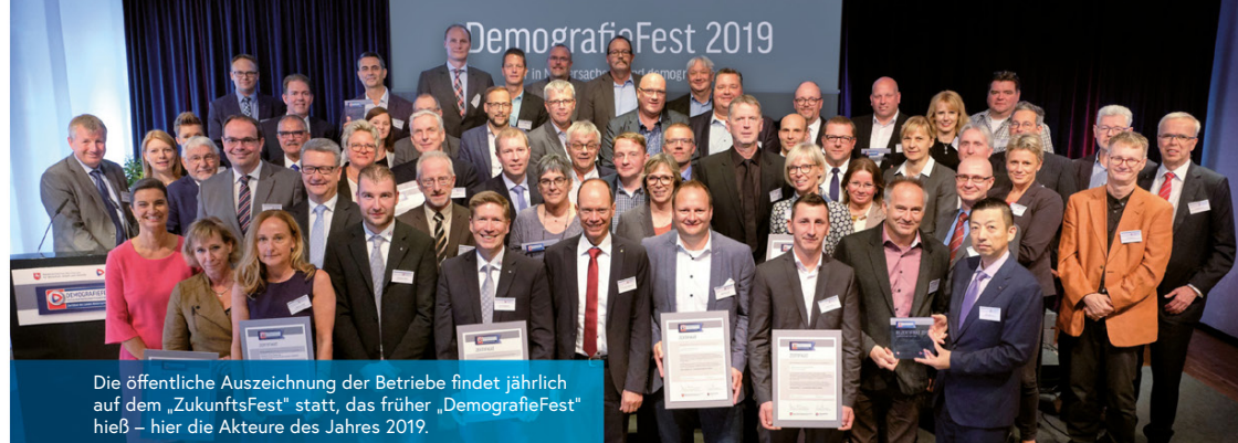
Die öffentliche Auszeichnung der Betriebe findet jährlich auf dem „Zukunftsfest“ statt, das früher „DemografieFest“ hieß – hier die Akteure des Jahres 2019.